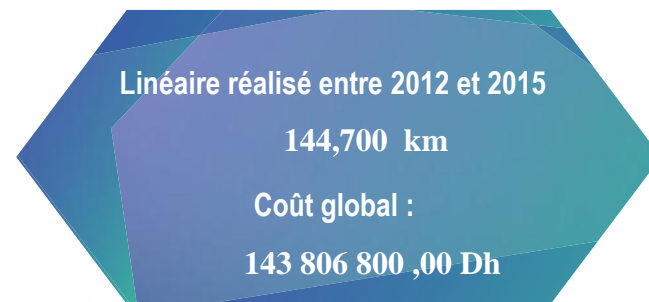
Les opération en cours de réalisation