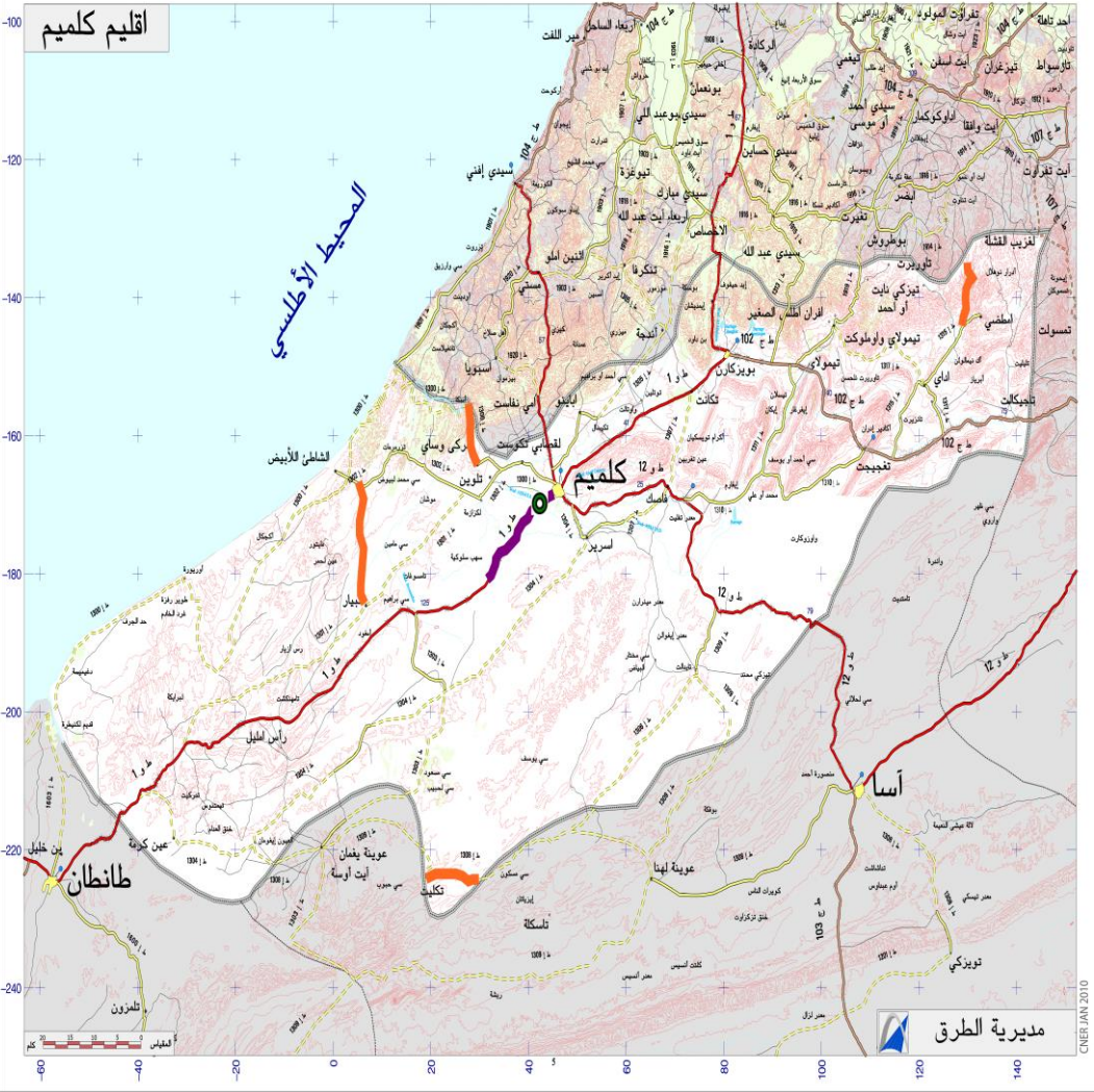
خريطة المشاريع الطرقية المنجزة ما بين 2012 - 2015