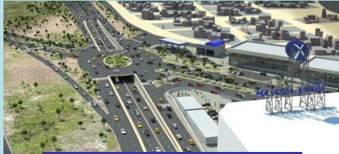
ممر تحت أرضي لأسواق السلام