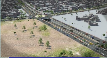
ممر تحت أرضي لشارع النخيل