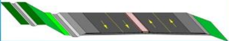
COUPE TYPE DE LA VOIE EXPRESS