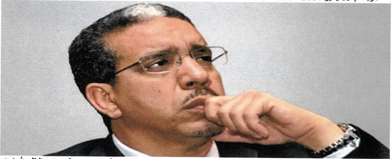
(عزيز الرباح وزير التجهيز والنقل (أرشيف)

استقبل عزيز الرباح، وزير التجهيز والنقل واللوجستيك، رفقة طالب برادة سفير المغرب بدار، أمس الثلاثاء، من قبل مانويل سيريفو نهامادجو رئيس المرحلة الانتقالية بغينيا بيساو.