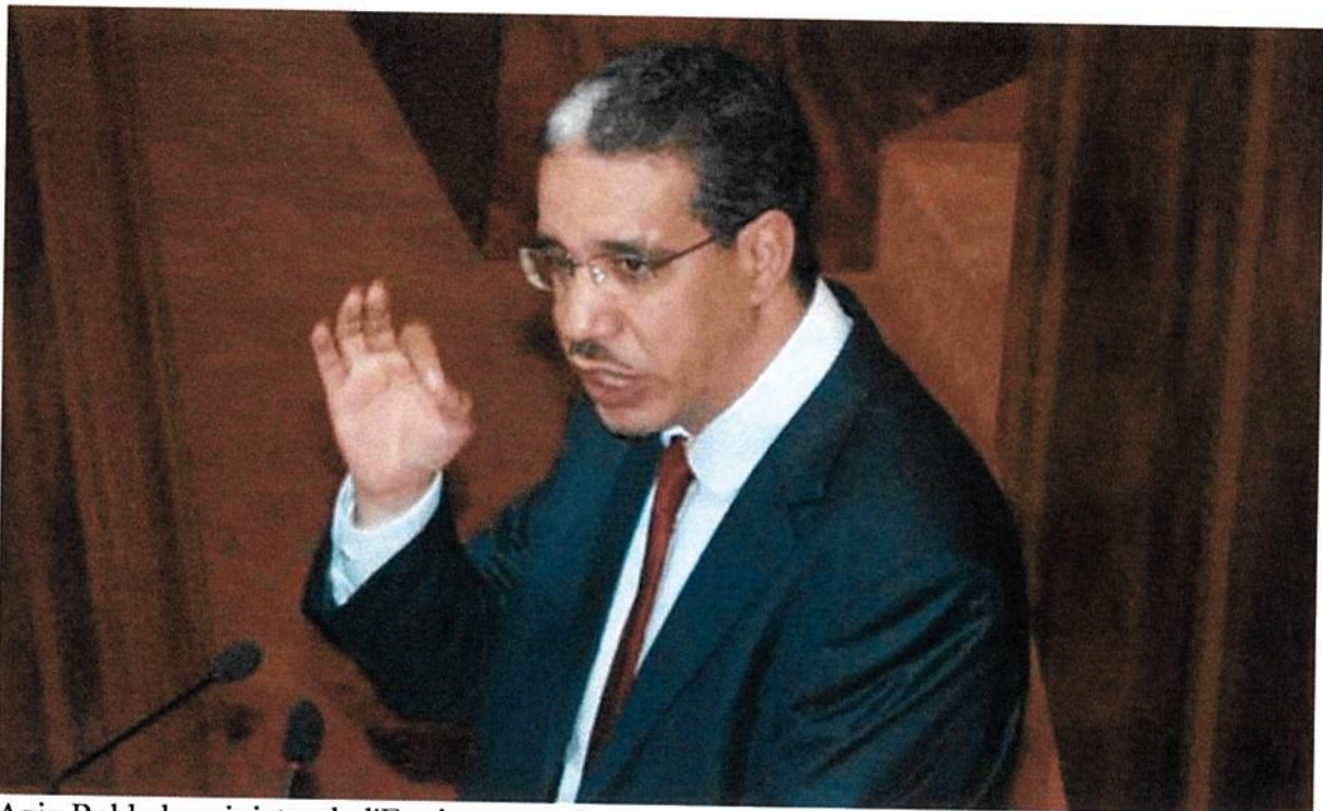
Aziz Rabbah, ministre de l'Équipement, du Transport et de la Logistique.

Rabbah a été reçu, en audience, par le président de transition de la République de Guinée Bissau, Manuel Serifo Nhamadjo.