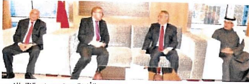
وزير الأشغال يجتمع بوزير النقل المغربي