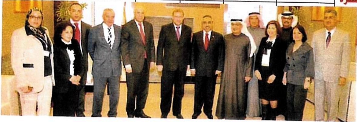
○ وزير الأشغال يستقبل الوفد المغربي.