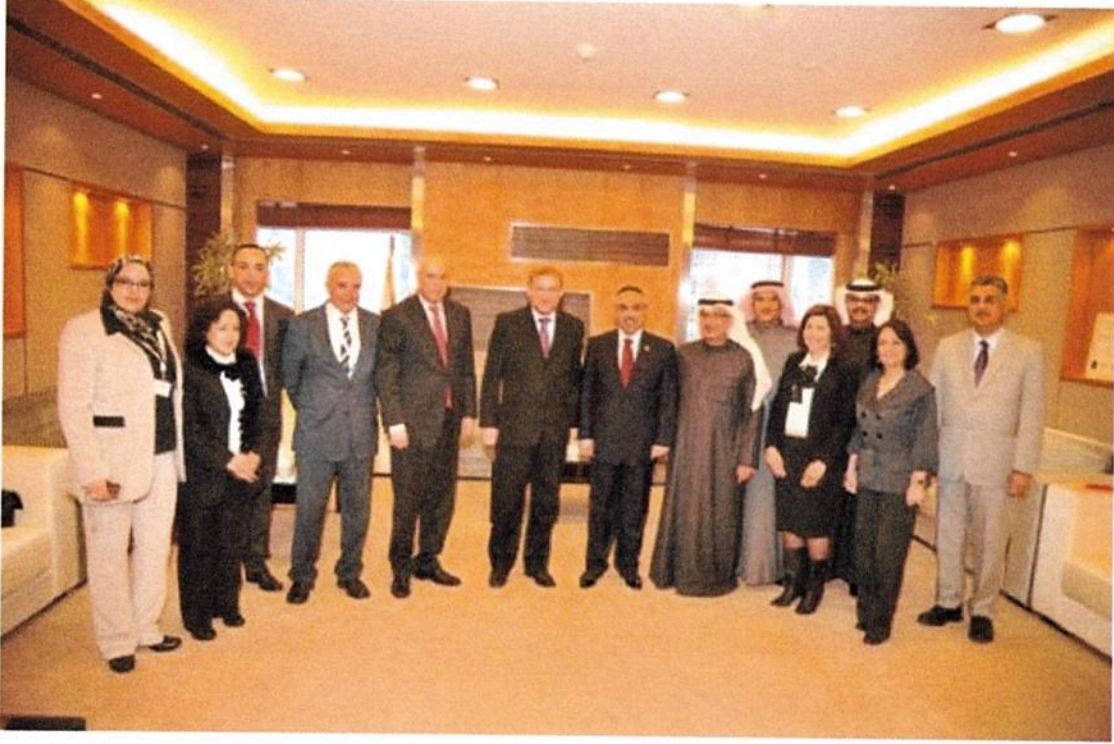
المنامة - وزارة الأشغال

استقبل وزير الأشغال عصام بن عبدالله خلف بمكتبه بديوان الوزارة وزير التجهيز والنقل واللوجستيك المكلف بالنقل محمد نجيب بوليف والوفد المرافق الذي يزور مملكة البحرين لحضور فعاليات معرض البحرين الدولي للطيران.