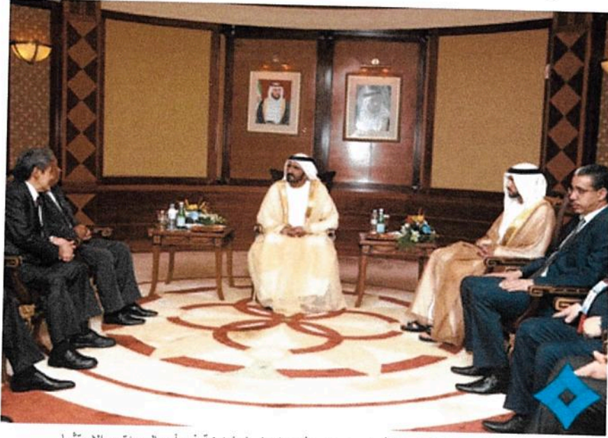
محمد بن راشد خلال لقائه عدداً من رؤساء وفود الدول المشاركة في أعمال مؤتمر الاستثمار

التقى صاحب السمو الشيخ محمد بن راشد آل مكتوم، نائب رئيس الدولة رئيس مجلس الوزراء حاكم دبي "رعاه الله"، في قاعة الملتقى في مركز دبي التجاري العالمي قبل ظهر اليوم، بحضور سمو الشيخ حمدان بن محمد بن راشد آل مكتوم، ولي عهد دبي وسمو الشيخ مكتوم بن محمد بن راشد آل مكتوم، نائب حاكم دبي، عدداً من رؤساء وفود الدول المشاركة في أعمال مؤتمر الاستثمار السنوي الرابع، وقد رحب سموه بكل من أصحاب المعالي محيي الدين ياسين، نائب رئيس الوزراء وزير التعليم المالي وبهجت باقورلي، النائب الأول لرئيس الوزراء في جمهورية كوسوفو وسمو الأمير محمد بلقيه، وزير الخارجية والتجارة في سلطنة بروناي دار السلام واغوربو رايسف، رئيس جمهورية ياقوتيا؛ إحدى جمهوريات الاتحاد الروسي ووزير التجهيز والنقل المغربي؛ عبدالعزيز رباح، وتمني لهم سموه التوفيق في ملتقاهم، الذي يجمع نخبة واسعة من المسؤولين والخبراء الاقتصاديين والمستثمرين من مختلف دول العالم خاصة العالم الثالث.