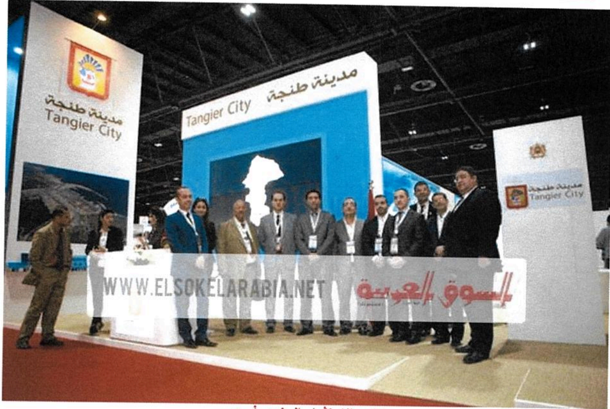
مؤتمر الاستثمار السنوي في دبي

محمد بن راشد آل مكتوم حضر جلسته الافتتاحية في دبي: