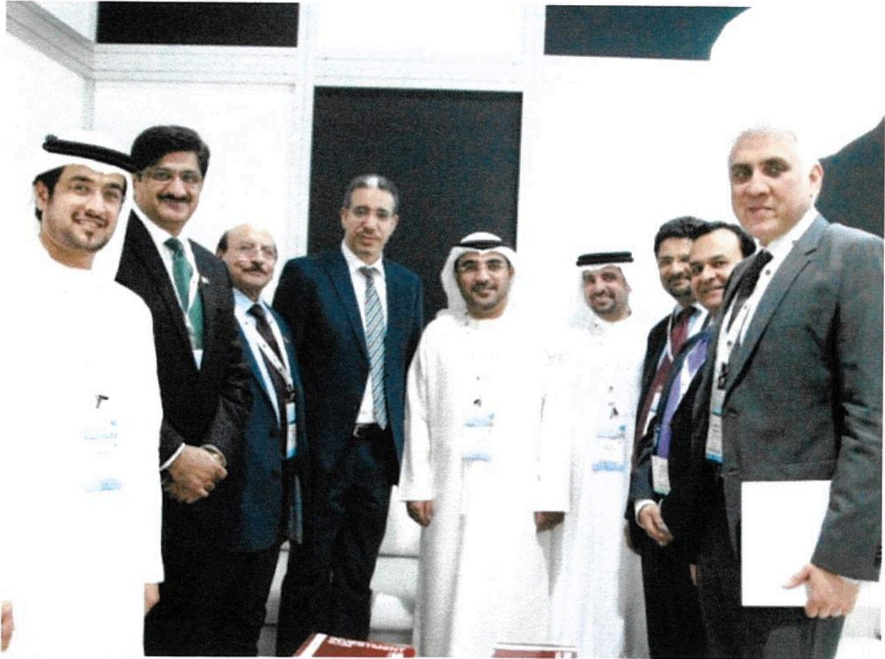
Chief Minister Sindh leads the Pakistani delegation at the Annual Investment Meeting in Dubai. PHOTO: PR KARACHI:

Promising his government's complete support, Sindh Chief Minister Syed Qaim Ali Shah on Tuesday invited foreign investors to invest in Karachi's proposed Bus Rapid Transit (BRT) project as well as in agriculture and excavation of mineral resources.