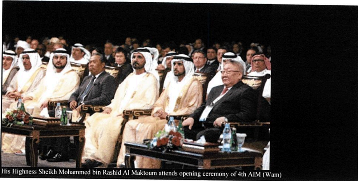
His Highness Sheikh Mohammed bin Rashid Al Maktoum attends opening ceremony of 4th AIM

The Annual Investment Meeting (AIM 2014) was inaugurated today (Tuesday) by His Highness Sheikh Mohammed bin Rashid Al Maktoum, Vice President and Prime Minister of the UAE and Ruler of Dubai, at the Dubai International Convention and Exhibition Centre.