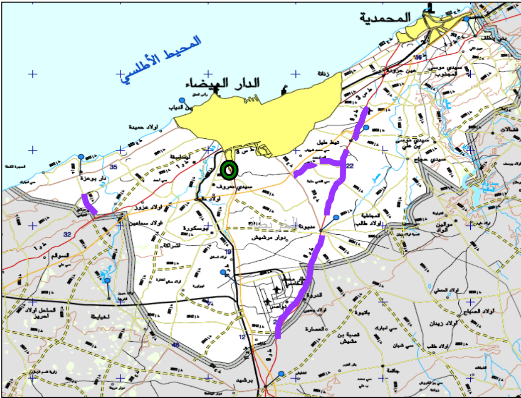
خريطة المشاريع الطرقية المنجزة ما بين 2012 - 2015